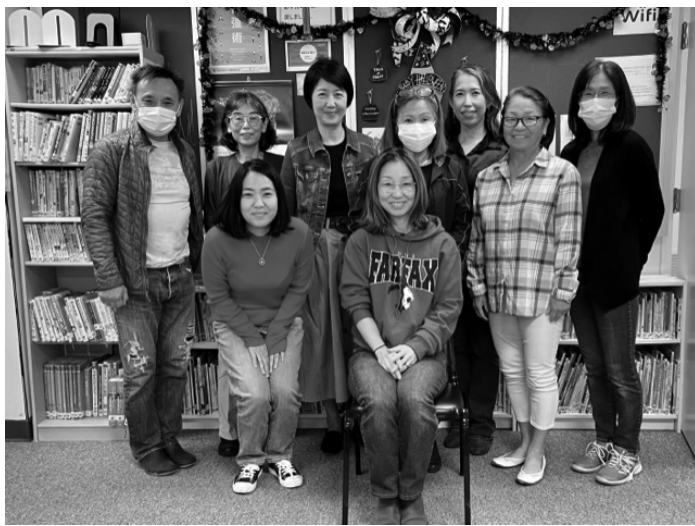
ケアファンドの執行委員の皆さん

とができる環境が整いつつあると感じています。食とは、単に空腹を満たす行為ではなく、心身の健康を保つために非常に大切なことです。また、世界的にコミュニケーションのデジタル化が当たり前になってきていますが、対面で食卓を囲んでのコミュニケーションに勝るものはないと確信しております。私たち飲食に携わる者として、皆様の大切なひと時のお手伝いをするのが何よりのやり甲斐となっております。これからワシントンの皆様から親しまれ続けるよう努力してまいります。新年を迎え皆様のご健康とご多幸を祈念し、謹んでお祈り申し上げます。